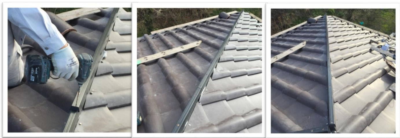
④ S系瓦の為 楽棟ハット 30 の上に更に楽棟ハット 15 を乗せ仮止め固定する。